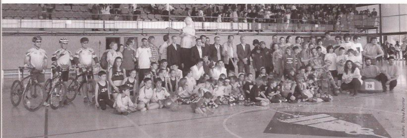
Totes les entitats esportives de Sant Just van mostrar el seu suport al Torneig Joan Petit en l'acte de presentació.

La presentació de la Festa-Torneig Joan Petit Nens amb Càncer va omplir de gom a gom les graderies del Complex Esportiu de La Bonaigua