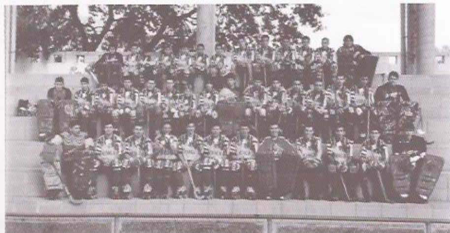
Presentació de la temporada 1999/2000

– Sembla ser que un equip entrenava amb música a la pista de l'escola Montserrat i alguns veïns es van queixar pel volum excessivament alt de la megafonia. He pogut consultar alguns documents a l'Ajuntament que recullen les queixes veïnals.